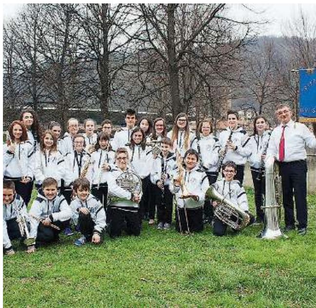
Giovani note. Alcuni musicisti della Banda Avis di Esine

La rassegna di quest'anno è dedicata a chi si prodiga per mantenere viva la tradizione delle 7 note