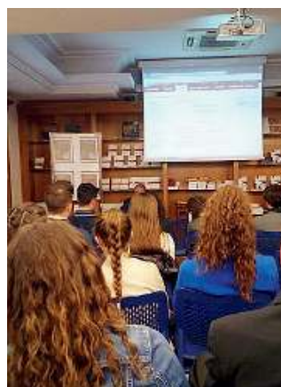
Civicamente. Uno degli incontri

■ Ragionare e meglio inquadrate il mondo delle istituzioni, della politica, del lavoro, dell'economia, del volontariato, insomma avere uno sguardo più attento sulla società.